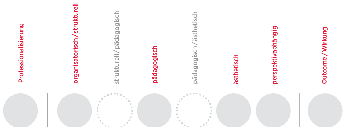
Schema zur Gruppierung der Qualitätsmerkmale